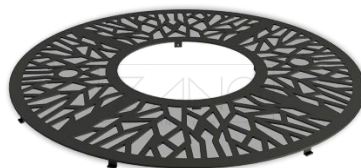
Propozycja kraty na drzewa

Na trasie ciągów pieszych należy zamontować kraty poziome na drzewa, ze wzorem, żeliwne, malowane na czarno.