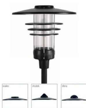
Propozycja oprawy oświetleniowej

Oprawy oświetleniowe parkowe na niskich słupach (do 5m). Część lamp zapalana na czujnik zmierzchowy, część na zegar sterujący, co umożliwia pozostawienie załączonych opraw dyżurnych na noc.