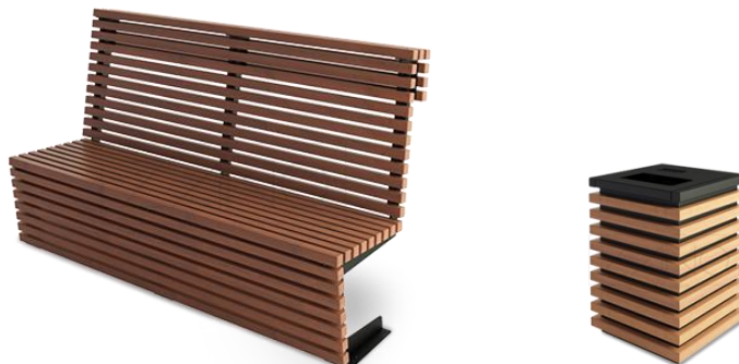
Propozycja ławki wraz z koszem

Kosz o konstrukcji stalowej, obudowany deskami impregnowanymi i malowanymi bejcą w kolorze naturalnym.