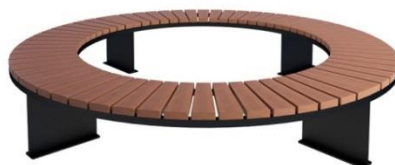
Propozycja ławki wokół drzew

ławka typu domino o konstrukcji stalowej z siedziskiem wypełnionym deskami impregnowanymi i pomalowanymi bejcą w kolorze naturalnym, konstrukcja stalowa malowana proszkowo w kolorze czarnym lub szarym.